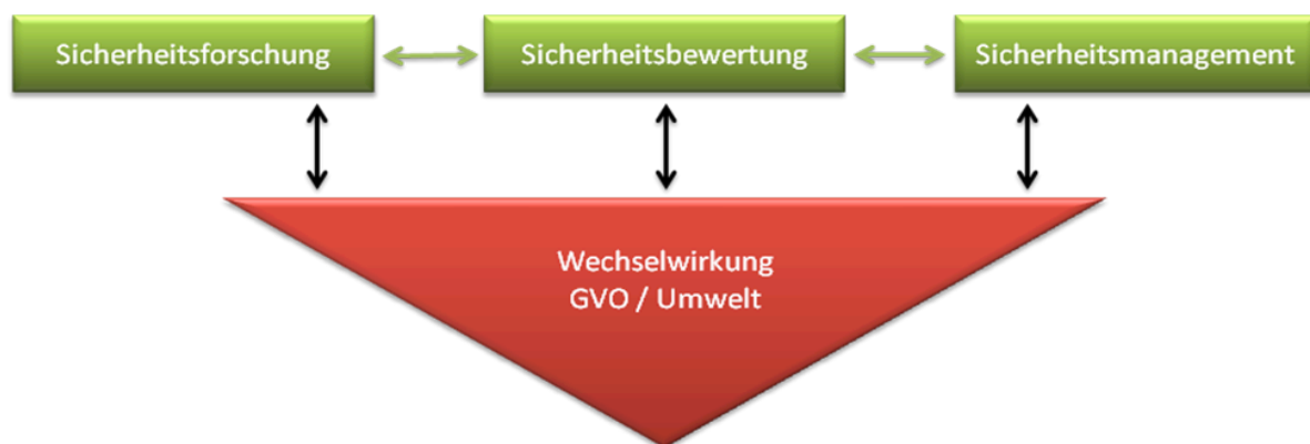
Abbildung 1: Ausbildungsziel „Zusammenspiel von Sicherheitsforschung, -bewertung und -management“

In den Studien- und Ausbildungsgängen im Bereich der Lebenswissenschaften sollte ein grundlegendes Verständnis von Sicherheitsforschung, -bewertung und -management vermittelt werden. Das Zusammenspiel dieser Bereiche (Abb. 1) ist eine wesentliche Voraussetzung für einen rationalen, verantwortlichen und aufgeklärten gesellschaftlichen Umgang mit neuen Technologien und Innovationen.